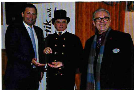
Lars Klingbeil - Reiner Baumann - Rainer Arndt

Als Gastredner trat der Bundestagsabgeordnete Lars Klingbeil (SPD) ans Rednerpult und rief zur Solidarität auf: "Wir müssen in der Region laut werden. Denn, wenn wir gehört werden, dann nehmen uns die Anderen wahr." Für den Abgeordneten stehen Themen wie der Internetausbau mittels Glasfaserleitungen, eine verlässliche Kinderbetreuung und die Nutzung der Platzrandstraßen während des Ausbaus der A7 ganz im Vordergrund. Ebenso lobte er das ehrenamtliche Engagement vieler Bürger/innen im Landkreis. Ohne diesen Beitrag würde unsere heutige Gesellschaft nicht mehr funktionieren.